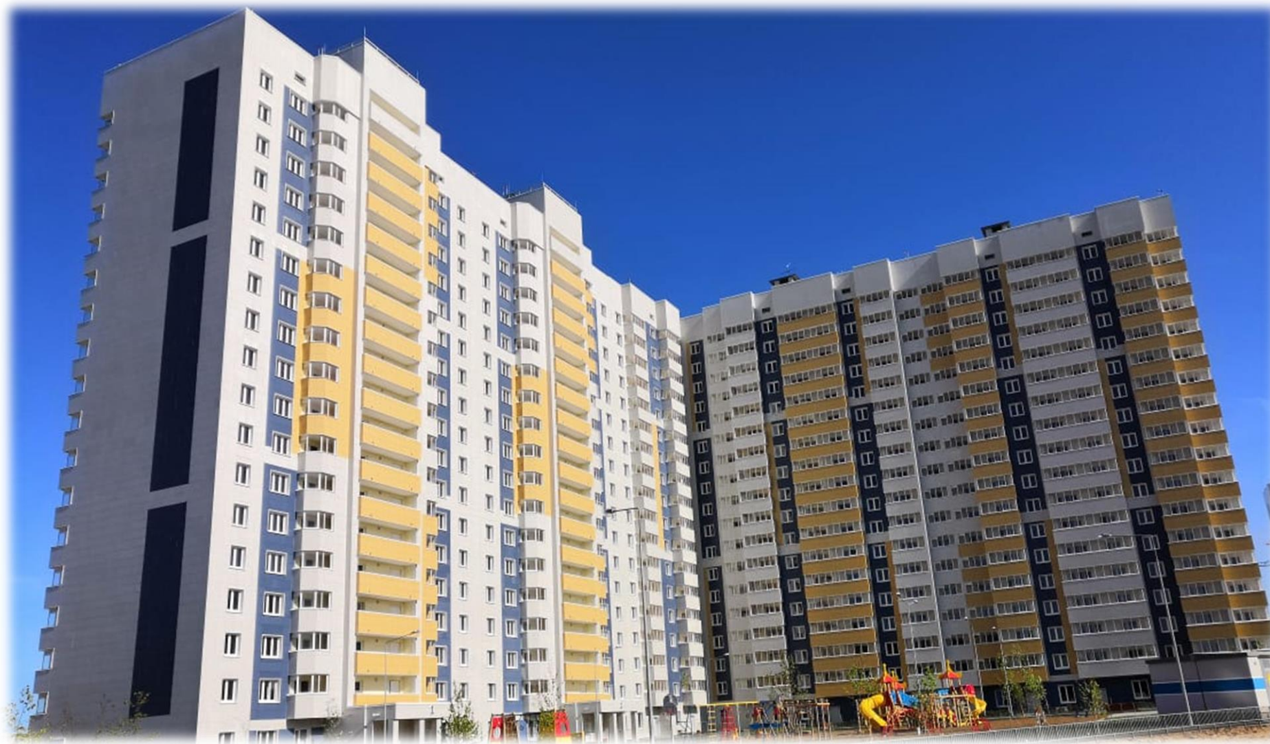
г. Казань, ж.р. «Салават Купере», 425-кв. жилой дом № 8-8 генподрядчик – ООО «Ак таш»