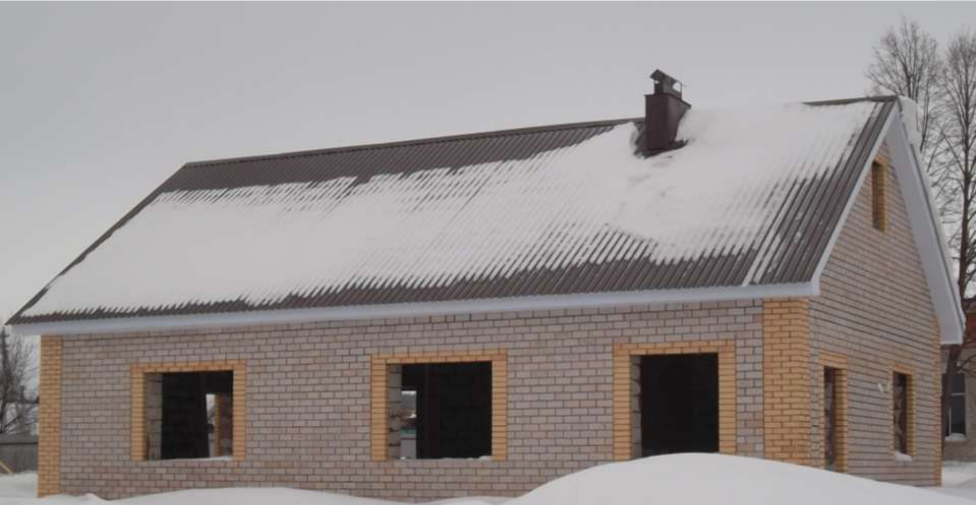
Агрызский район, с.Кичкетан Подрядчик - ООО «СК СтройГрад»