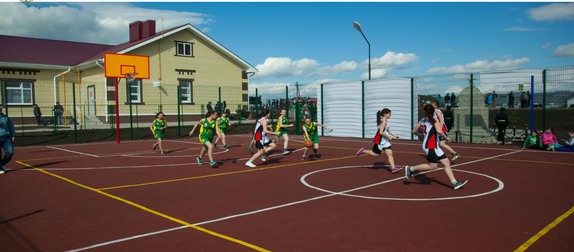
Кукморский МР, с. Лельвиж, ул. Школьная д.5 Подрядчик: ООО «Строй Гарант»