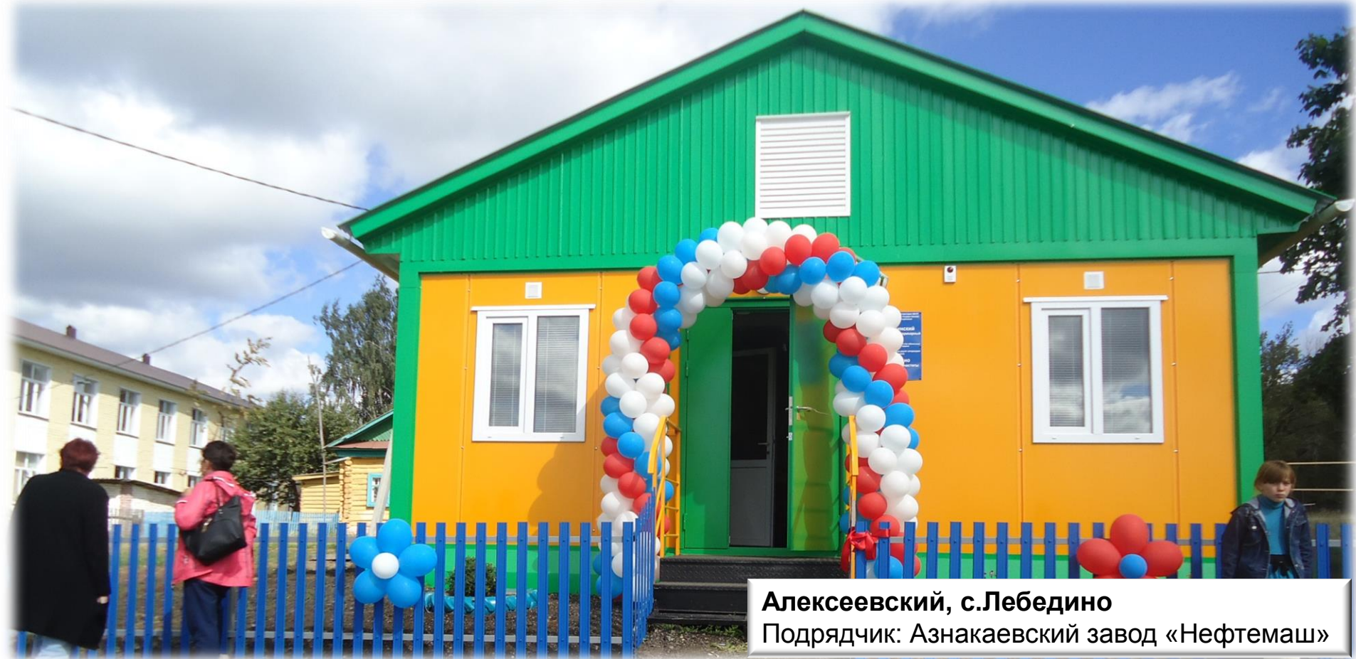
Алексеевский, с.Лебедино Подрядчик: Азнакаевский завод «Нефтемаш»