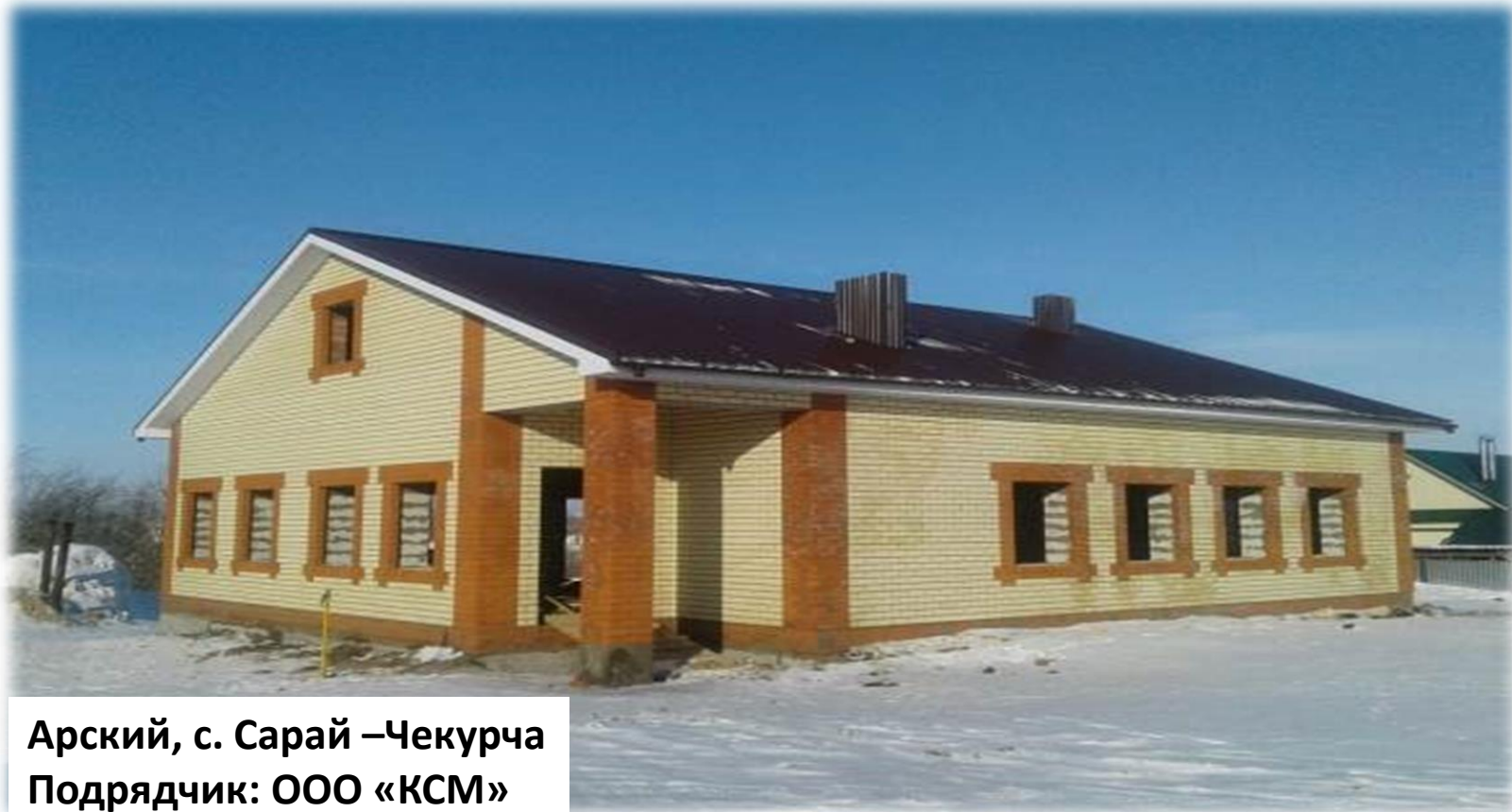
Арский, с. Сарай –Чекурча Подрядчик: ООО «КСМ»